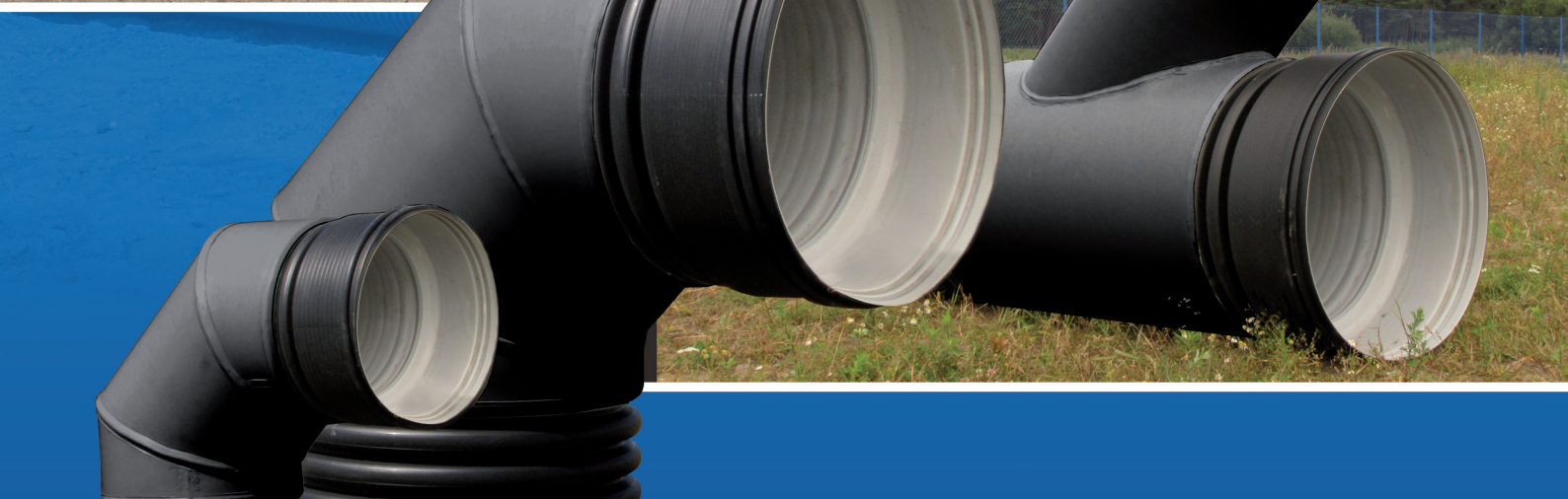
Rura kanalizacyjna Pecor Quattro SN8 z kielichem