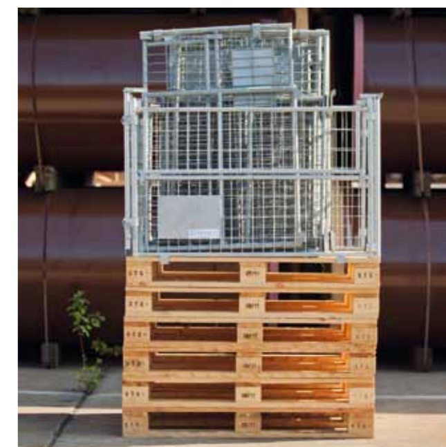
Zestawienie opakowań do zwrotu: 6 palet, 6 koszy z pokrywą – ułożonych jeden na drugim i złożonych – jak przedstawiono